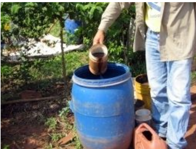
Foto 2: Elaboración de preparados botánicos para el control de plagas en Paraguay