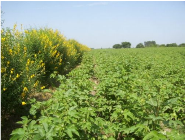
Foto 1: Campo de algodón orgánico con barrera de crotalaria en Chíncha, Perú

Nunca utilizar sustancias químicas o realizar prácticas que pongan en riesgo la certificación orgánica.