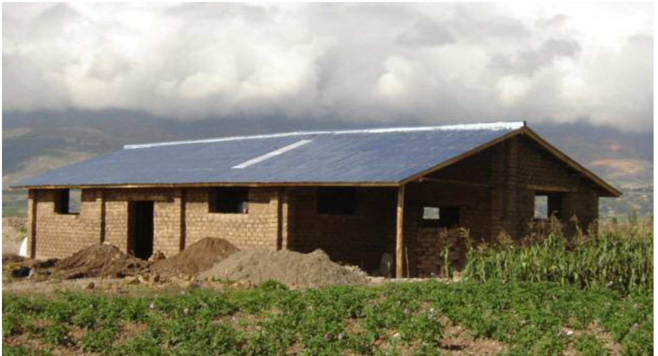
Centro de acopio ubicado en Barrio Común, Chupaca