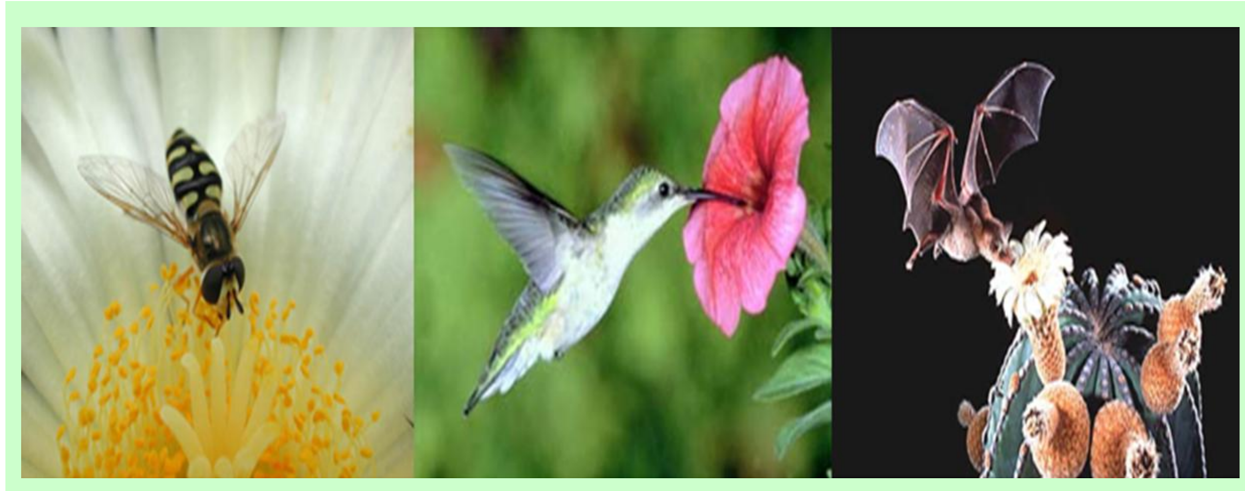
Figura 1. Los polinizadores más abundantes y variados son los insectos; los picaflores son atraídos por los colores rojizos, mientras que los murciélagos prefieren los colores pálidos y amarillentos.

La polinización realizada por insectos, aves y mamíferos (Figura 1) es un servicio ambiental de gran relevancia para la manutención de la integridad de los ecosistemas y para la sustentabilidad de la agricultura, por lo que es necesario mayor atención en el manejo agrícola y en las acciones conservacionistas. La producción agrícola y la diversidad de los agroecosistemas están amenazados por la disminución de las poblaciones de polinizadores debido a la fragmentación de hábitats, el uso de productos químicos y la introducción de especies exóticas. Mediante la ejecución del presente proyecto a través de la Red de Acción en Agricultura Alternativa (RAAA) y la Inter American Biodiversity Information Network (IABIN), se busca crear una primera base de datos de información científica de los polinizadores que existen en nuestro país para ser utilizado como una herramienta en la toma de decisiones a futuro.